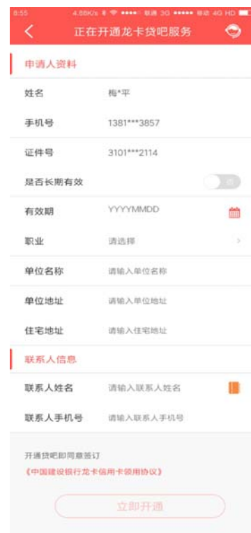
填写申请信息并提交